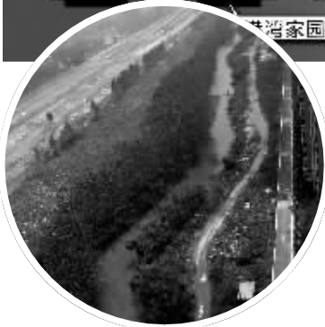
港湾家园北侧实景

绿地没了,挡风不说,楼和楼之间被堵得严严实实的,排出的废气滞留在两栋楼间散不出去,到时道路上的噪音、汽车尾气有增无减,绿地有自净能力,一旦减少,吃苦的是住在小区,工作在创业街的人。”6幢的这位业主表示。