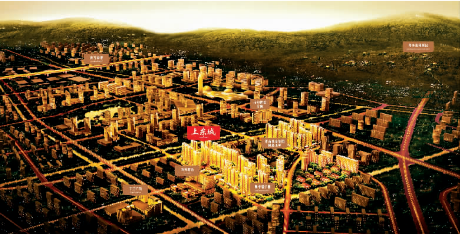
广宇·上东城区示意图

在下一步的实施方案中,杭州公交集团还将重点解决“丁桥与城西连接线”、“丁桥与九堡客运中心连接线”、“丁桥与半山连接线”以及“建成线路的新城穿越连接”等问题,“致力于几个新城,特别是丁桥区域公共交通的配套”。