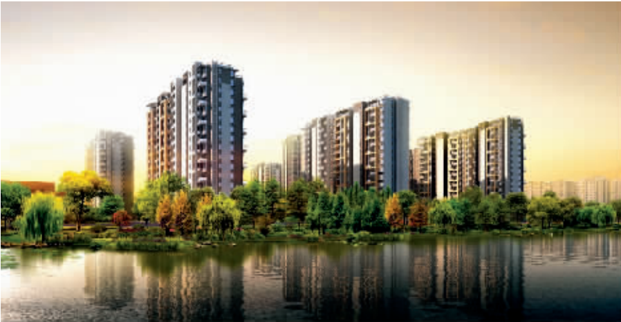
广宇·上东城效果图

未来的丁桥,将成为区别于西湖、区别于灵隐寺、区别于宋城、区别于西溪湿地的旅游之地,旅行社、老百姓喜欢的旅游项目,杭州在造最知名的重点旅游板块。今后的丁桥是一个有山有水、有文化的地方,是一个有乡村、有城市,可以触摸城市、感受乡村的地方,是一个城北新城的核心区,居住在这里面的40万老百姓无论是工作、生活、居住以及旅游等方面都能享受最好的一站式城市生活。