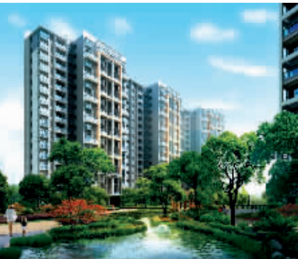
广宇·上东城效果图

据范国良镇长介绍,“这块地方是市中心最后一块绿地”,杭州东北角以丁桥为中心的黄鹤山、皋亭山,与西湖东南角的群山形成对峙之势,是杭州坐北朝南的“靠山”。在面向长三角的休闲旅游定位规划中,将重点围绕“古运河第一站文化”、“赏桃胜地”、“佛教文化宝地”、“丁兰孝文化与父母亲情游”、“兵家文化”、“科技休闲旅游”做文章,初步规划“上塘河与山脉为轴,城市游客接待区为中心,融合观光与休闲、度假三片区”为“一心两轴三片区”蓝图,招商引进星级酒店、第三代、第四